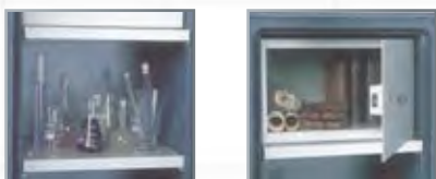
Acessórios interiores (da parte esquerda): Prateleira, compartimento com fecho.