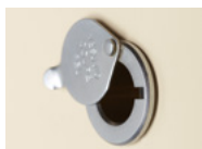
MIRILLA CLÁSICA Cromada o latón