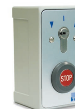
Caja eléctrica 686 con parada de emergencia y Stop