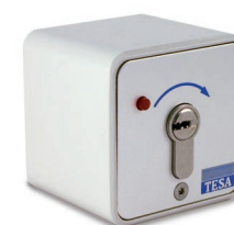
Caja eléctrica 686

La posibilidad de disponer de un medio cilindro electrónico de medidas 35 x 10mm., nos permite instalarlo con la amplia gama de cajas eléctricas disponibles en el catálogo de TESA.