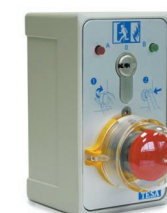
Caja eléctrica 686 con parada de emergencia y protector