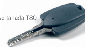
Llave tallada T80