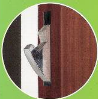
Fechos em gancho

A fechadura VERTIPOINT existe em duas cores : branco e castanho.