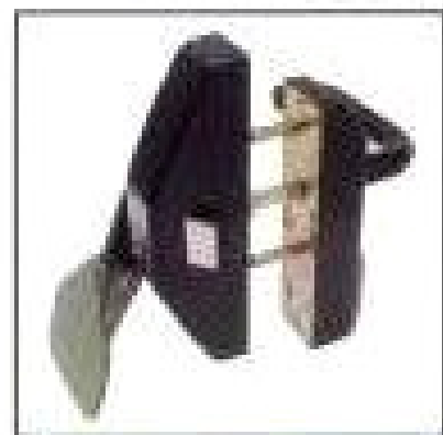
SALIDA DE EMERGENCIA