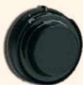
Fecho de Combinação